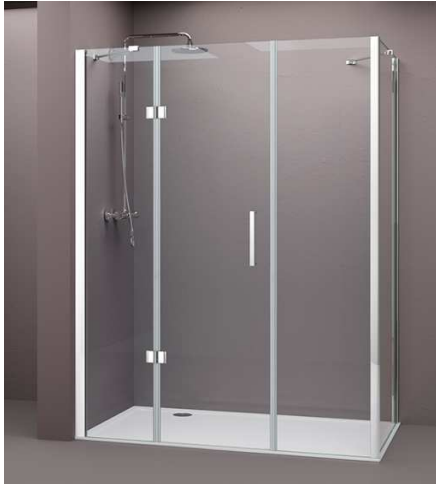
Esempio Porta battente 100 + In-Line 90 + Lato fisso 70