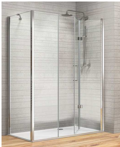
Esempio Porta pieghevole 80 + In-Line 90 + lato fisso 80